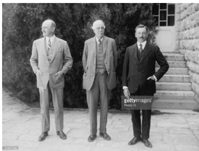
بالفور با سر هربرت ساموئل (سمت چپ) در قدس

در کنار تمام این فرضیه‌ها در باب شخص بالفور، این اظهار نظر مبنی بر یهودی بودن او یا اینکه شدیداً تحت تأثیر تربیت مادرش با اعتقادات کتاب مقدسی مهم بوده، باید مدنظر باشد. به هر حال او مجری ایده بسیار بزرگی در تاریخ استعمار و صهیونیسم است و در مسیر تحقق صهیونیسم، بنیامین دیزرائیلی‌ها، روچیلدها، موشه مونتیه فیوری‌ها، سر هربرت ساموئل‌ها و... افراد کم‌اهمیت و کم‌مایه‌ای با آن سوابق و ریشه‌های یهودی نبوده‌اند.