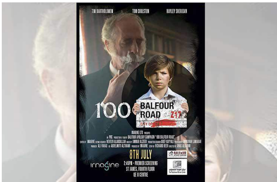
پوستر فیلم در مورد صد سالگی اعلامیه بالفور

را بر دوش عده‌ای قلیل از صهیونیست‌هایی که هنوز خود را پایبند به اسرائیل می‌دانند، بیندازند. صد سالگی صدور اعلامیه بالفور باعث نشده است که مردم فلسطین حق خود را فراموش کنند و از آن دست بردارند و امثال محمود عباس و ریاض المالکی به عنوان به اصطلاح نمایندگان مردم فلسطین با توجه به فضای داخل فلسطین مجبور هستند که ژست ضد انگلیسی به خود گرفته و از این کشور درخواست عذرخواهی از مردم فلسطین نمایند. ۱ یا از انگلیس در مجامع حقوقی بین‌المللی به دلیل این خبط تاریخی شکایت کنند. ۲