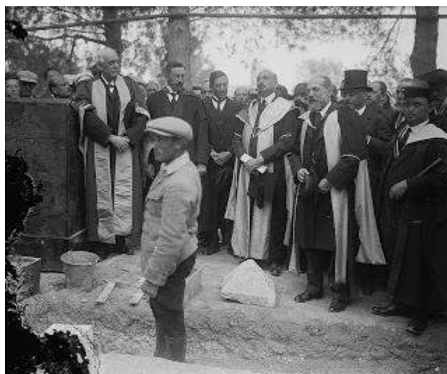
بالفور به هنگام راهاندازی دانشگاه عبری اورشلیم

در کنار تمام این فرضیه‌ها در باب شخص بالفور، این اظهار نظر مبنی بر یهودی بودن او یا اینکه شدیداً تحت تأثیر تربیت مادرش با اعتقادات کتاب مقدسی مهم بوده، باید مدنظر باشد. به هر حال او مجری ایده بسیار بزرگی در تاریخ استعمار و صهیونیسم است و در مسیر تحقق صهیونیسم، بنیامین دیزرائیلی‌ها، روچیلدها، موشه مونتیه فیوری‌ها، سر هربرت ساموئل‌ها و... افراد کم‌اهمیت و کم‌مایه‌ای با آن سوابق و ریشه‌های یهودی نبوده‌اند.